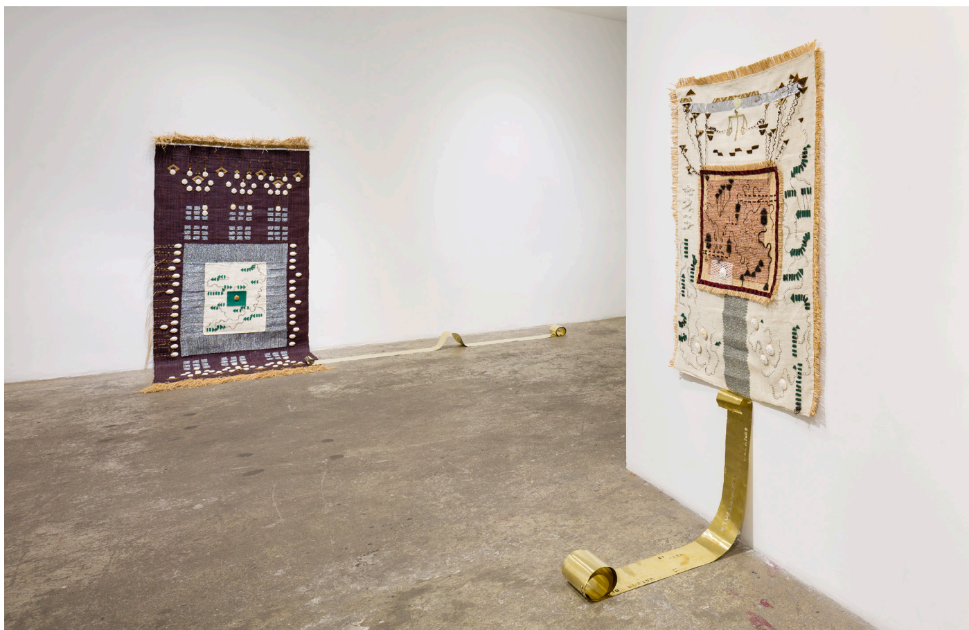
Map #23 Rubans laitons, 2019, Fibre de jute, cheveux, grattoir, fibre de rafia, aluminium, laitons, 231 x 358 cm Map #2.1 Rubans laitons, 2019, Fibre de jute, cheveux, grattoir, fibre de rafia, aluminium, laitons, or, plâtre, 150 x 118 cm Support : Région Île-de-France